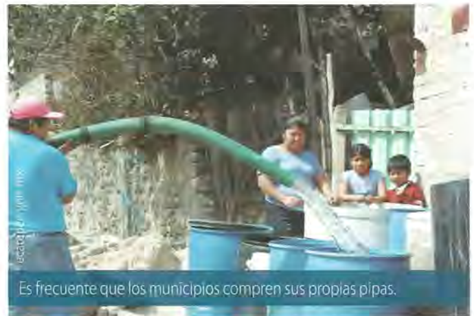
Es frecuente que los municipios compren sus propias pipas.

En general, el abastecimiento de agua se lleva a cabo por tres medios: la red del servicio público, que puede encontrarse dentro de la vivienda o fuera de ella pero en el terreno; la compra