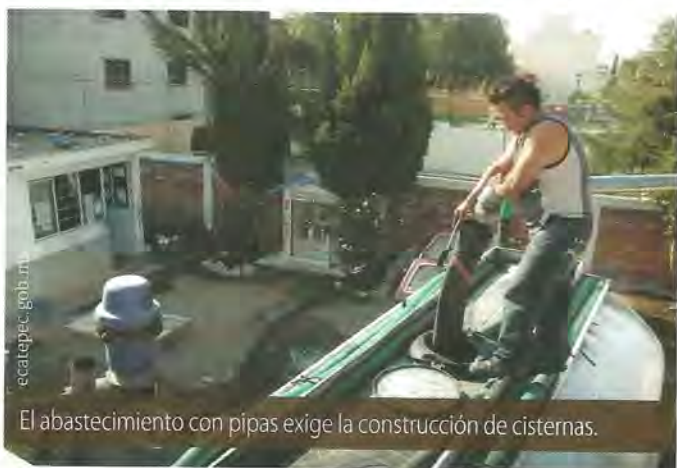
El abastecimiento con pipas exige la construcción de cisternas.

La ineficiencia de los servicios de agua potable provoca que los usuarios busquen opciones para asegurar el abastecimiento y esto, a su vez, se traduce en el empoderamiento de empresas, generalmente irregulares, que dificultan por diversos medios la transición hacia un servicio adecuado que México requiere. Los intereses asociados a estos actores, junto con el descontento de los pobladores por el mal servicio, suelen expresarse cada vez con mayor regularidad e intensidad en conflictos abiertos por el agua, cuyas manifestaciones alcanzan la magnitud de lo ocurrido en mayo en el pueblo de San Bartolo Ameyalco, en la delegación Álvaro Obregón, donde más de 100 personas resultaron heridas en un enfrentamiento entre agentes de la Secretaría de Seguridad Pública del Distrito Federal y pobladores que querían