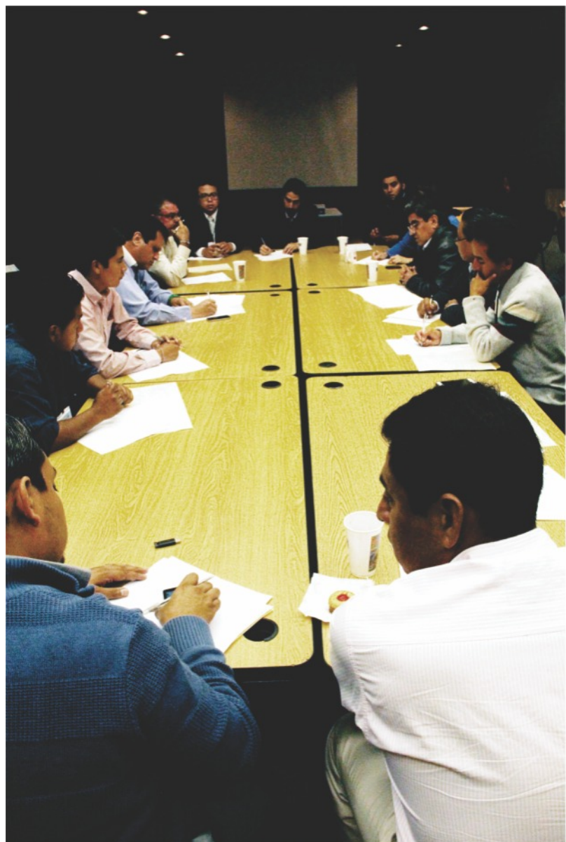
Taller “Intercambio de experiencias en la operación de sistemas municipales de agua potable”.