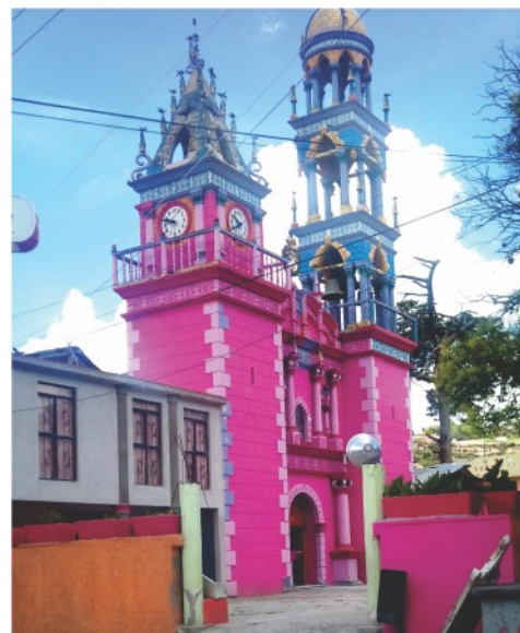
Templo de la Virgen de El Carmen.

El Observatorio Hídrico de la UNAM desarrolla en el municipio acciones para fomentar una participación informada de la ciudadanía en la gestión de sus recursos hídricos