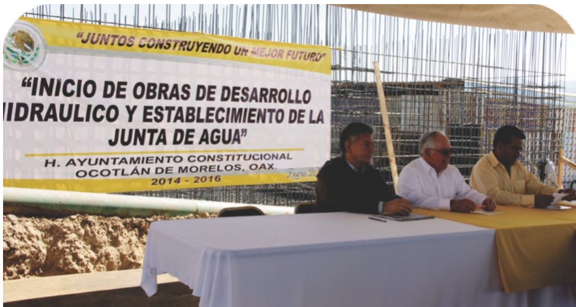
Juntas con Comités Ciudadanos.

Generalmente, la gestión comunitaria se asocia a los contextos rurales